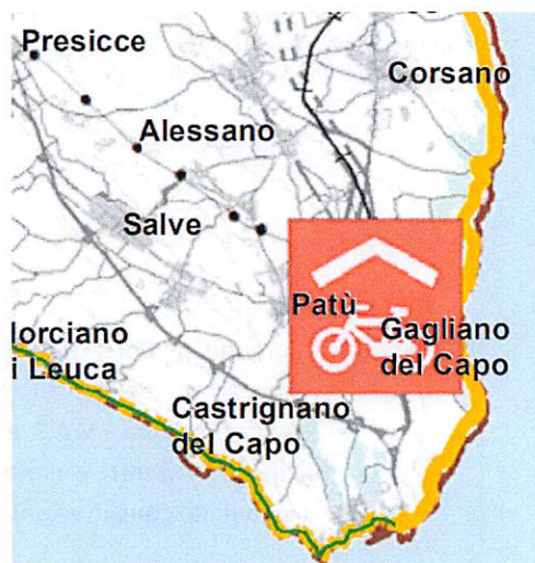
Fig. n. 1: PIANO ATTUATIVO 2015_2019 Tavola Mobilità Ciclistica