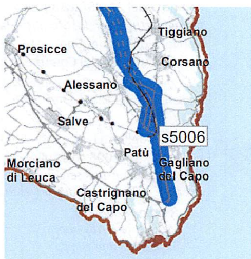
Fig. n. 2: PIANO ATTUATIVO 2015_2019 Tavola Trasporto Stradale